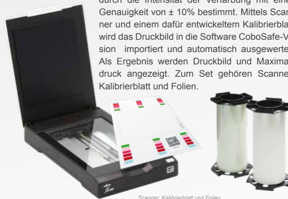
Scanner, Kalibrierblatt und Folien

Die Folien reagieren auf den Druck und zeigen die Druckverteilung an. Die Druckkraft wird durch die Intensität der Verfärbung mit einer Genauigkeit von \pm 10\% bestimmt. Mittels Scanner und einem dafür entwickeltem Kalibrierblatt wird das Druckbild in die Software CoboSafe-Vision importiert und automatisch ausgewertet. Als Ergebnis werden Druckbild und Maximaldruck angezeigt. Zum Set gehören Scanner, Kalibrierblatt und Folien.