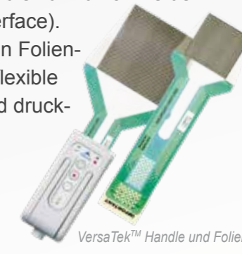
VersaTek™ Handle und Folien