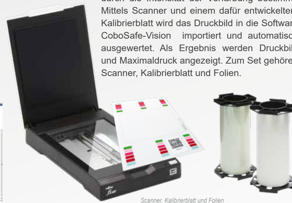
Scanner, Kalibrierblatt und Folien

Die Folien reagieren auf den Druck und zeigen die Druckverteilung an. Die Druckkraft wird durch die Intensität der Verfärbung bestimmt. Mittels Scanner und einem dafür entwickeltem Kalibrierblatt wird das Druckbild in die Software CoboSafe-Vision importiert und automatisch ausgewertet. Als Ergebnis werden Druckbild und Maximaldruck angezeigt. Zum Set gehören Scanner, Kalibrierblatt und Folien.