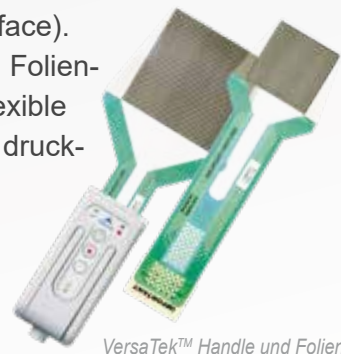
VersaTek™ Handle und Folien