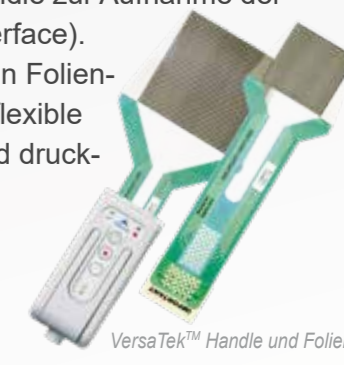
VersaTek™ Handle und Folien